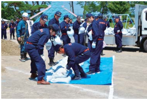
▲災害に備え訓練を重ねる消防団員

安全確保を最優先に考えてほしいです。 日頃から地震対策として、テレビやタンスなどの家具類に転倒防止器具を取り付けて固定することが何より大事です。 食料の備蓄も大切なことですが、生きていてこそ活用できるものです。