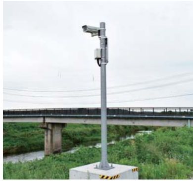
▲善川の水量を24時間監視 (衡下地区・海老沢橋付近)