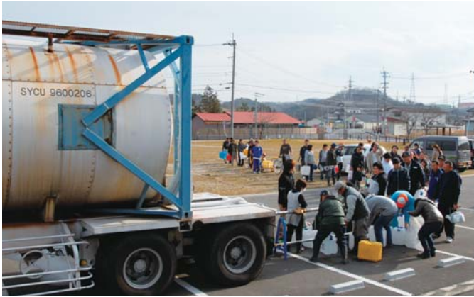
▲断水が続き給水車が出勤 (東日本大震災)

近年は、土木技術や水防工法などの発達により川の氾濫回数は抑えられつつありますが、温暖化などの気候変動により豪雨の回数が増えており、引き続き警戒する必要があります。