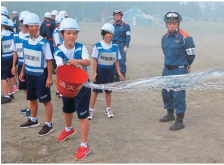
▲宮城県9・1総合防災訓練（令和元年）には中学生も参加

「災害が多くなっていることもあり関心があるので、機会があればぜひ参加してみたいです。」