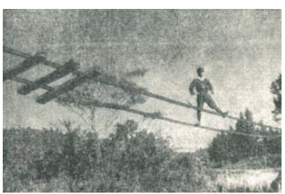
▲台風で宙づりになった軽便鉄道の線路

私たちの住んでいる大衡村でも、昭和22年のカスリーン台風と昭和23年のアイオン台風により甚大な被害を受け、特に当時村内を走っていた仙台鉄道株式会社（軽便鉄道）の施設が壊滅的な被害を受けたことにより、鉄道が廃止された経緯があります。