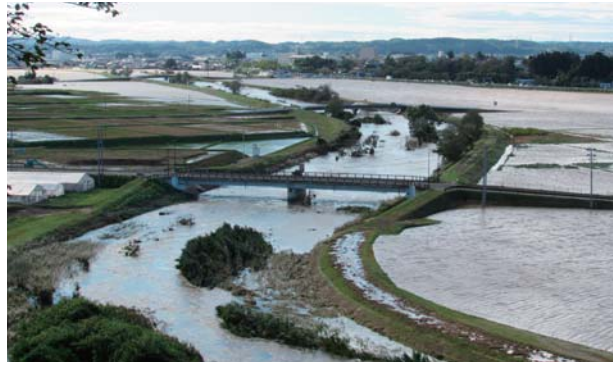
▲善川からあふれた水により水田が冠水 (衡下地区雁又橋付近・令和元年東日本台風)

近年は、土木技術や水防工法などの発達により川の氾濫回数は抑えられつつありますが、温暖化などの気候変動により豪雨の回数が増えており、引き続き警戒する必要があります。