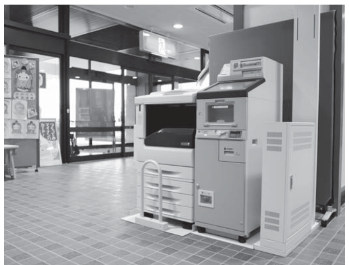
⑪証明書コンビニ交付構築事業(マルチコピー機設置)