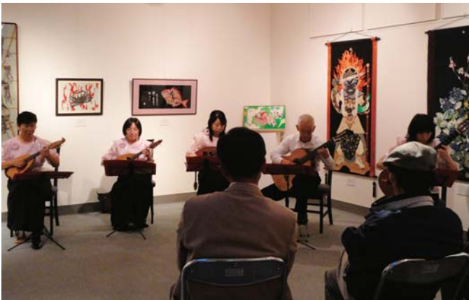
▲マンドリンコンサート