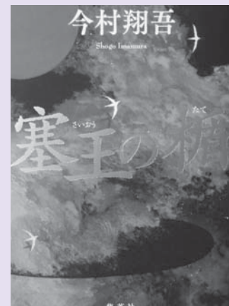
「塞王の楯」 著者 今村 翔吾