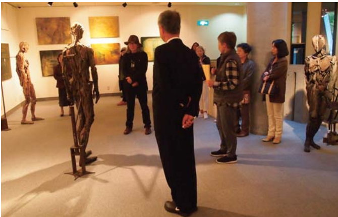
▲作家による作品解説「ギャラリートーク」