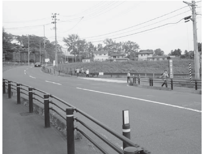
⑦平林線防護柵設置事業