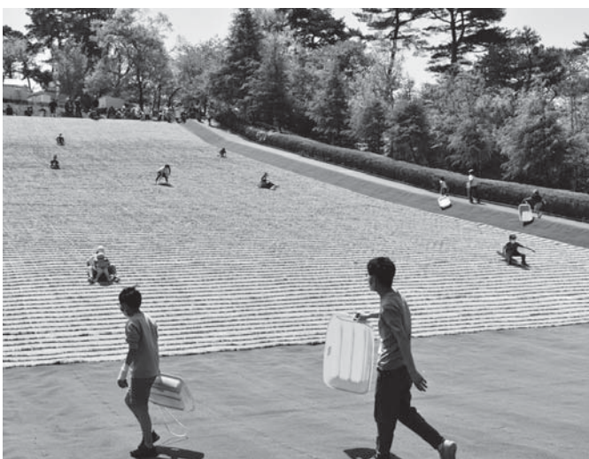
⑨公園遊具更新事業