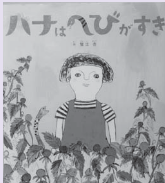
「ハナはへびがすき」 著者 蟹江 杏