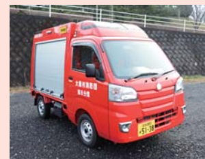
▲救助用資機材・小型動力ポンプ搬送車(第8分団)