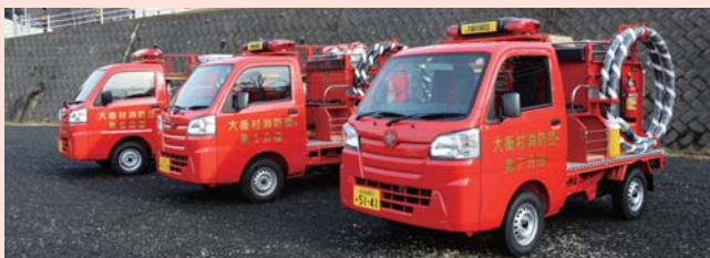
▲小型動力ポンプ付軽積載車(第1・6・7分団)