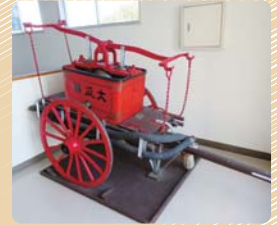
▲昭和40年ごろまで使われた腕用ポンプとまとい