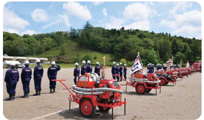
大衡村消防団消防演習