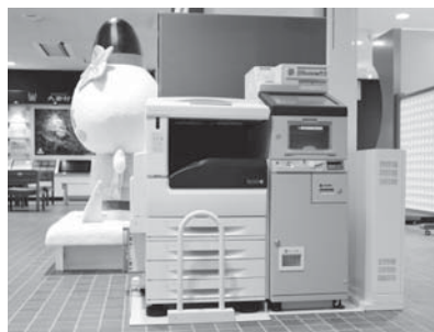
役場1階村民ホールにもキオスク端末を設置しました