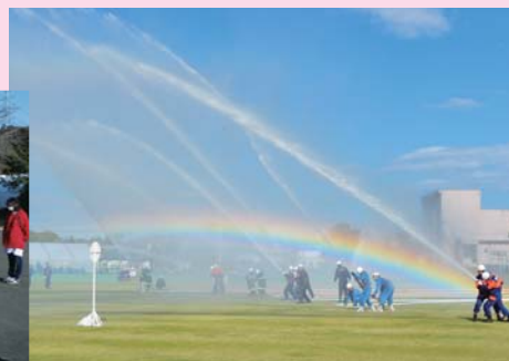
6月 黒川地区連合演習