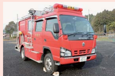
▲消防ポンプ自動車(第5分団)