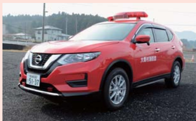
▲消防団指揮車(本部)

大衡村消防団は、本部とラップ隊及び10分団編成で組織されています。定員は200名ですが、令和3年12月1日現在の団員数は140名となっています。