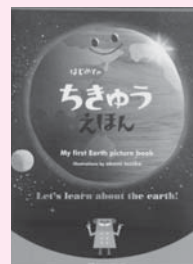
はじめてのちきゅうえほん 斎藤紀男 てづかあけみ 村田弘子著