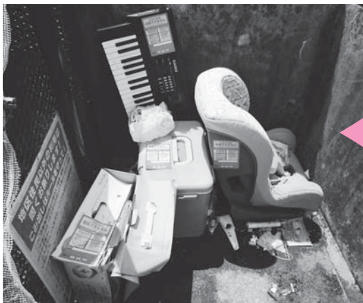
チャイルドシート・キーボード等

また、粗大ごみとして処分できるかご不明の場合は、環境管理センターへ問い合わせください。