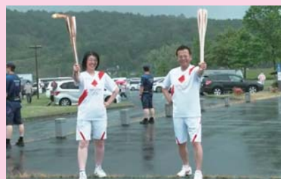
▲聖火を引き継ぎ決めポーズ！