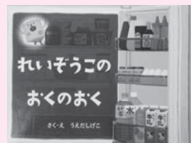
れいぞうこのおくのおく うえだしげこ 著