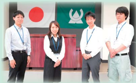
(令和3年度採用職員)