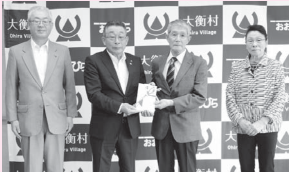
※撮影のためマスクをはずしています