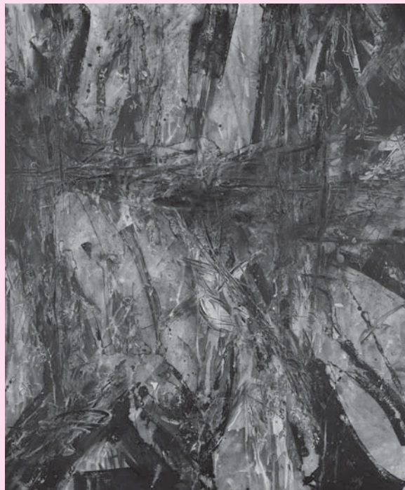
▲「歪(いびつ)」 F30号 アクリル