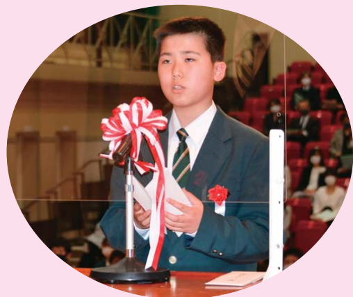
▲新入学生代表による誓いの言葉