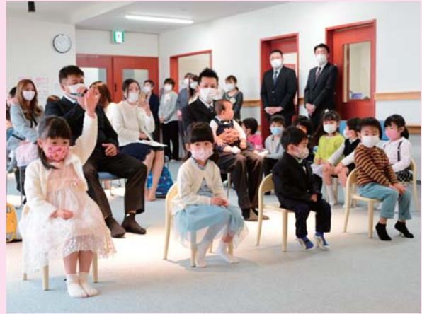
▲みんな、仲良くしてね！