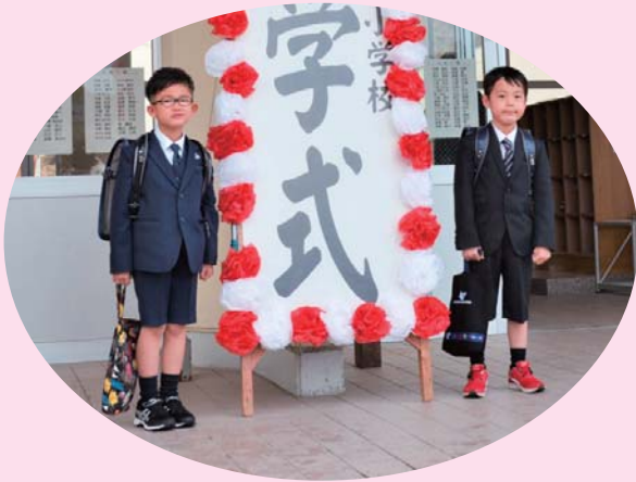
▲ランドセル、ちょっと重いか？