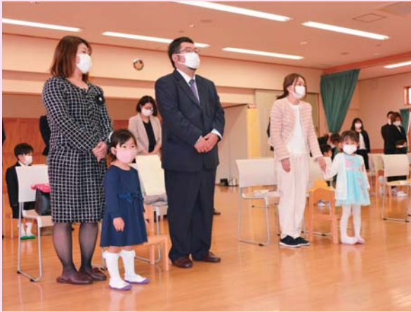
▲新生活に親子でドキドキわくわく