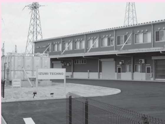
▲株式会社イズミテクノノ宮城工場