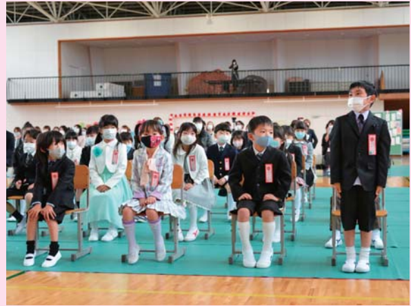
▲元気に返事ができました