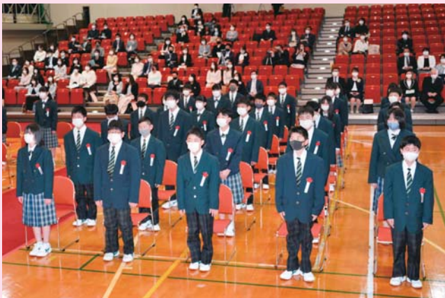
▲新しい制服に気持ちも引き締まります