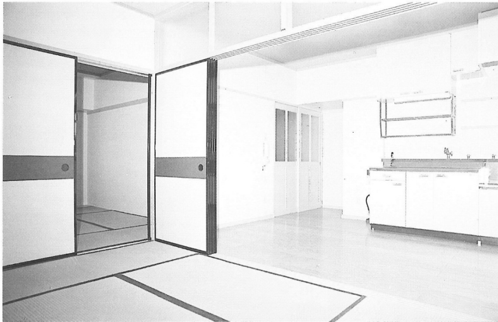
部屋番号が 偶数 の部屋