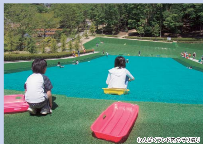
わんぱくランド内のそり滑り