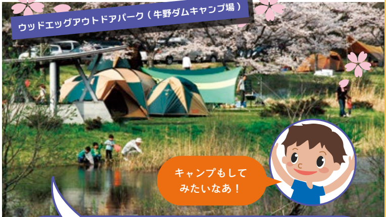
ウッドエッグアウトドアパーク(牛野ダムキャンプ場)

こうえんい がい おおひらむら 公園以外にも、大衡村には、キャン プをする人たちの間で人気がある、 キャンプ場があるんだ。 「ウッドエッグアウトドアパーク」 うしの じょう (牛野ダムキャンプ場) というんだ。