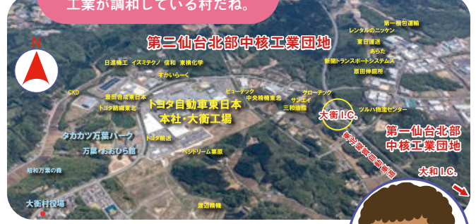
第三仙台北部中核工業団地

かんれん こうじょう 関連する工場がどんどんできて、ますます 工業が発展していく地域なんだね。