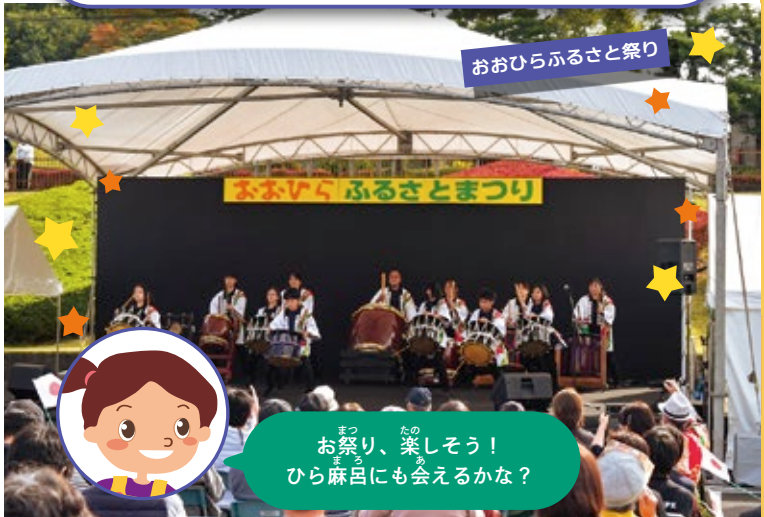
おおひらむらさと祭り

10月には村のお祭りもあるよ。その日は、たくさん の人たちでにぎわうから、遊びに来てね。