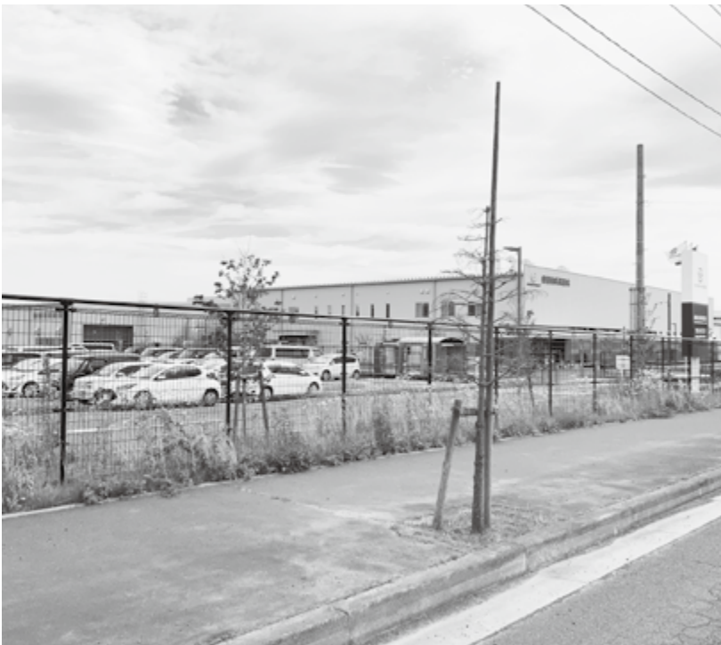
多くの企業が進出している第二仙台北部工業団地

私自らトップセールスで、企業訪問やセミナー等の誘致活動に積極的に取り組んでいく。