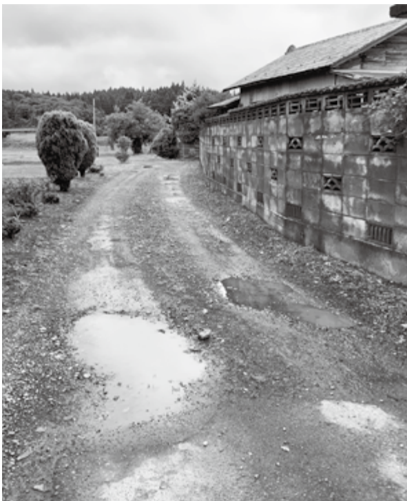
整備が求められる生活道路

企画財政課長 地域おこし協力隊の募集にあたり、どういった分野で活用できるのか検討してきたが、現時点においては実施まで至っていない。