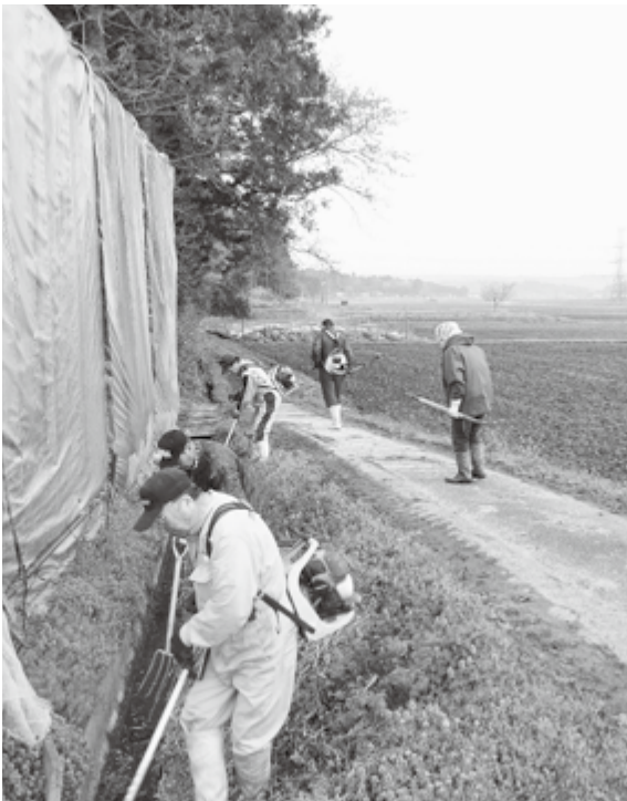
保全会による共同作業