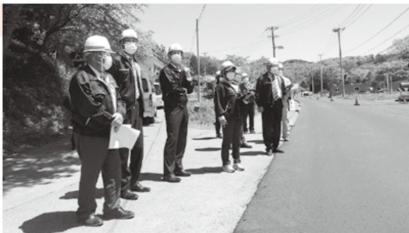
村道榎田戸口線改良舗装工事調査