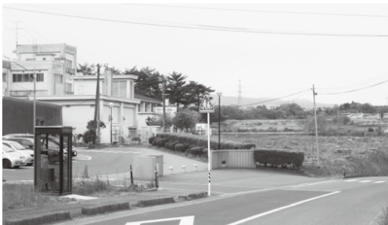
学校給食センター建設予定地（中学校敷地内）

キャンプ場整備については、住民の意見や利用者のニーズに合った有料化整備計画をまとめられたい。