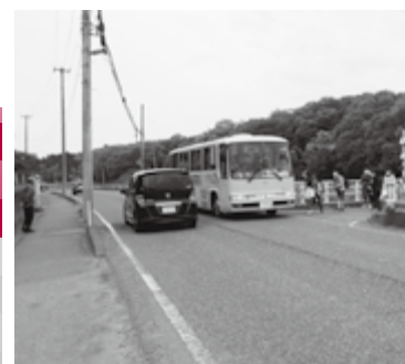
県道を横断し万葉バスに乗車 奥田中沢バス停