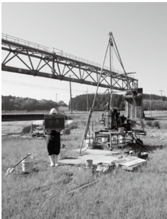
期待される大衡仙台線（地質調査）