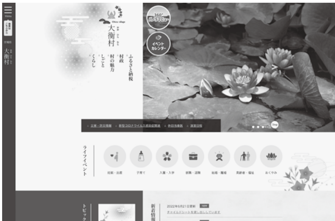
村ホームページのトップ画面