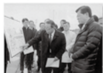
石井国土交通大臣に 国道4号線の現状を説明