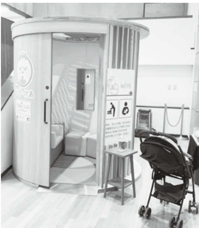
県民の森中央記念館内の簡易型授乳室

場所の確保が課題となっているが、安心して出かけられるように簡易型授乳室の活用等、小スペースでも設置できる工夫をし整備に努めたい。