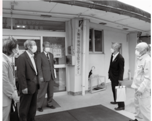
大衡村社会福祉協議会の調査