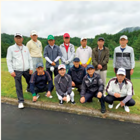
プレーできることに感謝