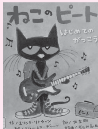
「ねこのピート はじめてのがっこう」 著者 エリック・リトウィン