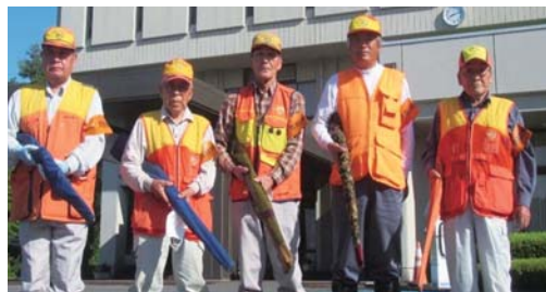
⑥鳥獣被害対策実施隊員の育成

有害鳥獣被害を防ぐためには村と地区そして一人一人の次のような協力が必要になります。