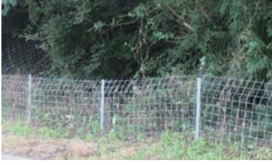
①ワイヤーメッシュ柵の購入 (国の交付金活用)