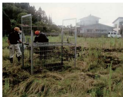
⑤実施隊員による捕獲活動