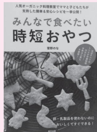
「みんなで食べたい時短おやつ」 著者 菅野 のな