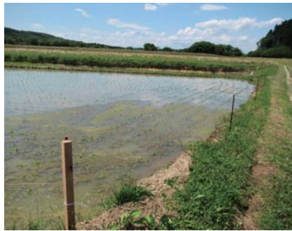
③電気柵等設置(補助制度あり)