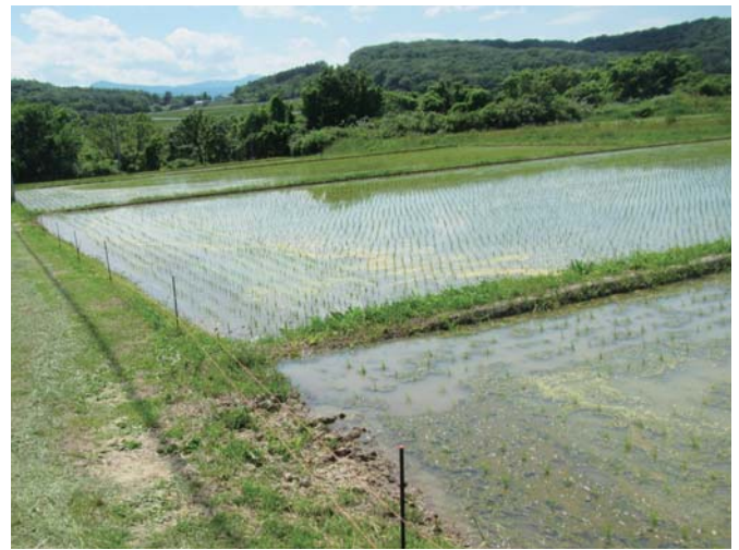
▲イノシシに荒らされた水田

このような鳥獣被害を防ぐために具体的にどのような対策が必要なのか考えてみましょう。