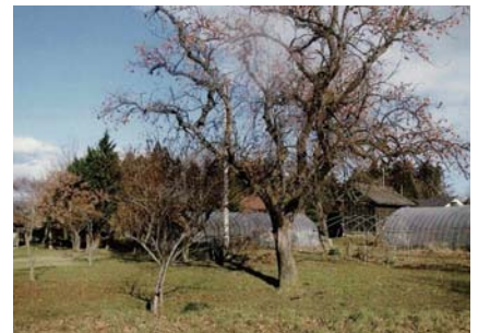
④誘因物の除去・未収穫の処分