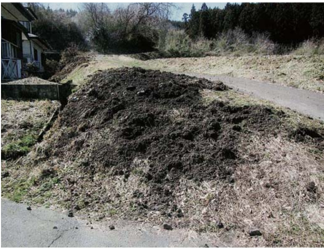
▲イノシシに掘られた法面