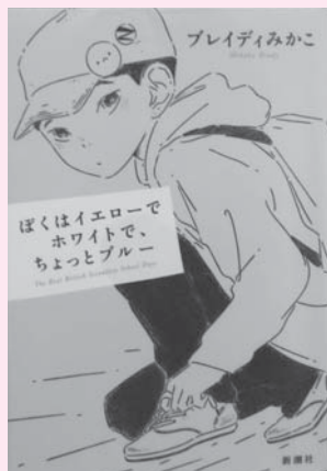
「ぼくはイエローでホワイトで、ちょっとブルー」 著者 プレイディみかこ