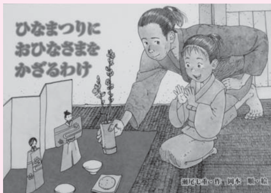
「ひなまつりにおひなさまをかざるわけ」 著者 瀬尾 七重