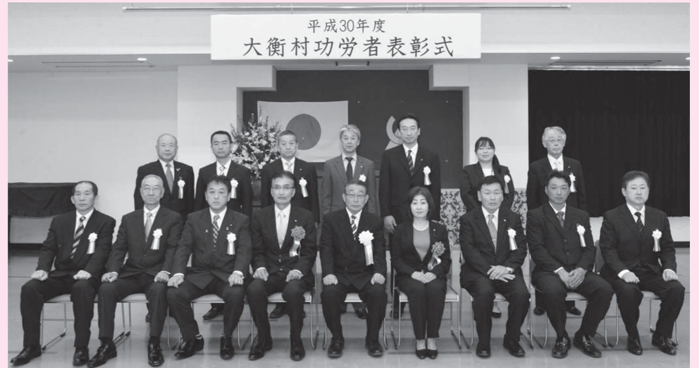
平成30年度 大衡村功勞者表彰式