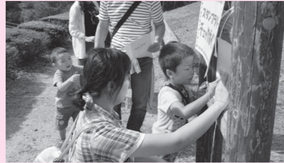
▲スタンプラリーハイキングコース