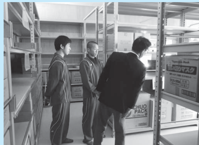
▲防災備蓄倉庫の説明を受ける高校生