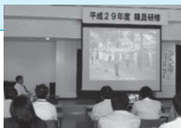
▲役場職員も新しい地域づくりについて学びました

村では、この自主的な活動を『地域の宝物』と称し、地域づくりとして応援します。また、大衡村社会福祉協議会と一緒に取材させていただき広くお知らせしていく予定です。ご紹介したい活動がありましたら、ぜひご連絡ください。