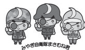
みやぎ自衛隊まさむね