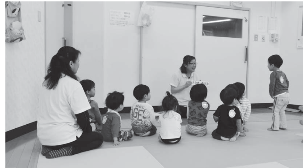
①地域型保育施設整備事業(万葉にこここ保育園)

平成28年度において村が施工・実施した 事務事業は、村民の皆様のご協力により完 了しましたので、その主な事業を紹介しま す。(平成27年度繰越事業含む)