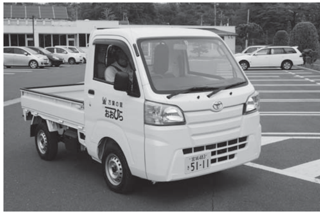
④大衡小学校軽トラック購入事業