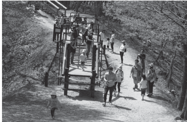
⑦万葉クリエートパーク遊具更新事業(吊橋)