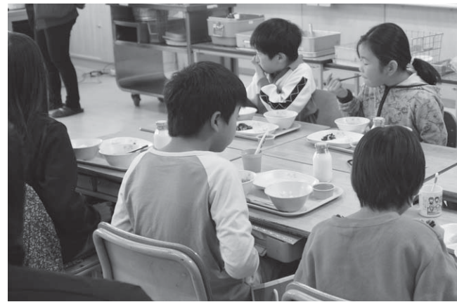
⑤学校給食センター給食用食器購入事業