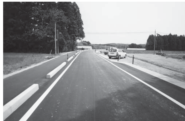
⑨尾西中山線改良舗装事業