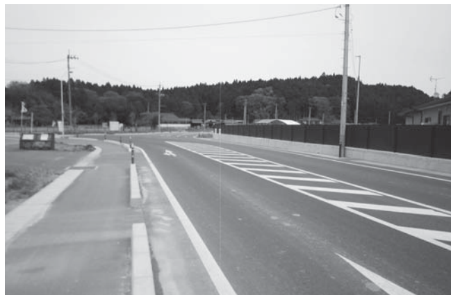
⑧奥田大森線改良舗装事業