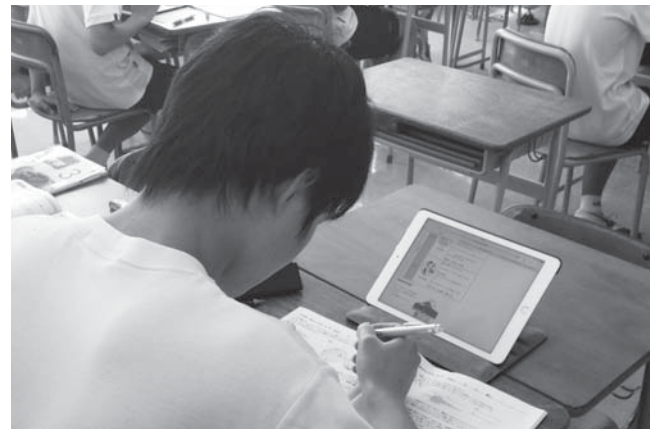
⑥大衡中学校電子黒板・タブレット購入事業(タブレット)