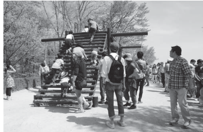
⑦万葉クリエートパーク遊具更新事業(スイングネット)