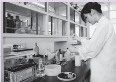
分析機関での品質分析