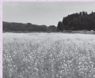
原料の油種作物(菜の花)

軽油に5%以下のバイオディーゼル燃料(BDF)を混合した燃料です。BDFは燃焼時にCO 2 を排出しますが、このCO 2 は原料の植物が生長過程で吸収したCO 2 なので、大気中のCO 2 を増やしません。また、BDFの原料である植物(油種作物)は、毎年生産できるためB5が広く利用されることで、化石燃料の節約にもつながります。