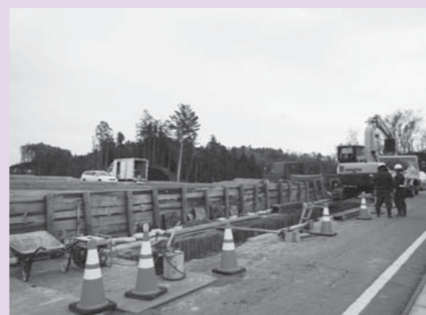
下水道整備工事を行っています