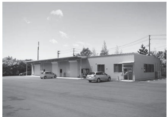
⑫企業立地促進奨励金