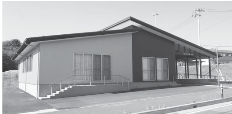
⑤ときわ台コミュニティ施設整備事業(防衛省補助事業)