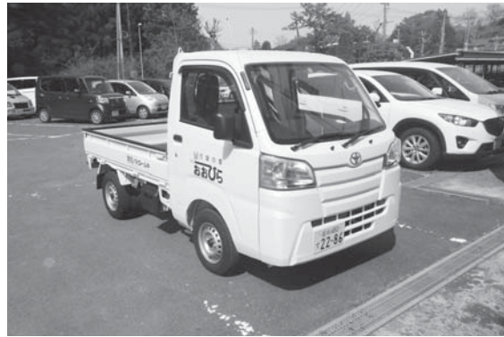
④大衡中学校軽トラック購入事業