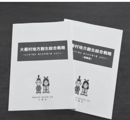
⑯大衡村人口ビジョン・地域創生総合戦略策定事業(環境省補助事業)