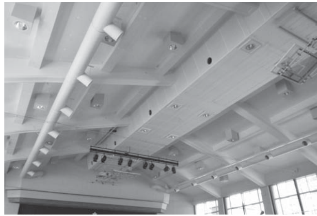
③大衡中学校講堂改修事業(文部科学省補助事業)