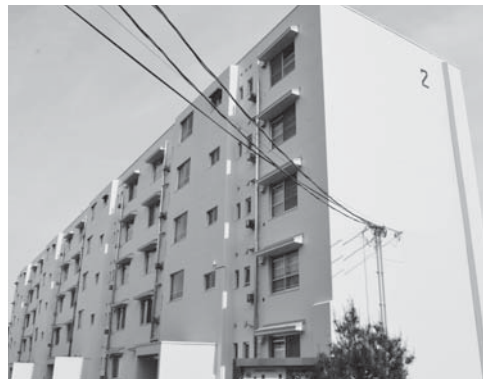
⑥定住促進住宅2号棟外壁改修事業