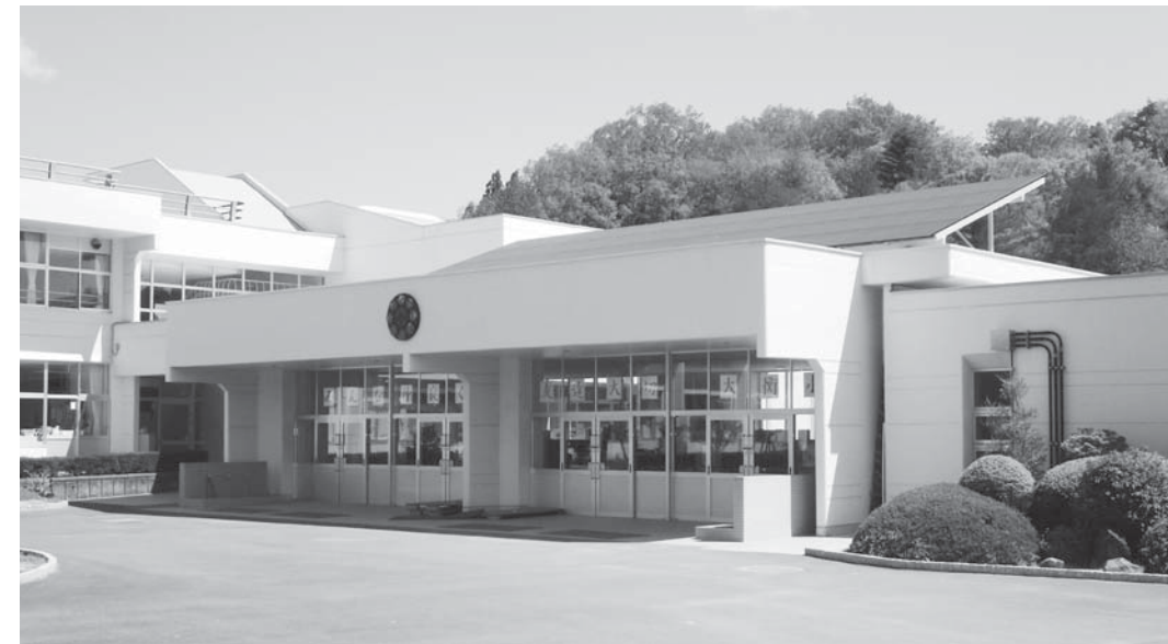
①大衡小学校太陽光発電設備等導入事業(環境省補助事業)

平成27年度において村が施工・実施した 事務事業は、村民の皆様のご協力により完 了しましたので、その主な事業を紹介しま す。(平成26年度繰越事業含む)