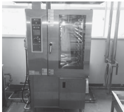
⑦学校給食センターコンピオープン購入事業