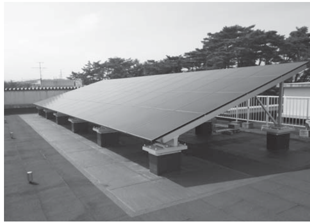
②大衡中学校太陽光発電設備等導入事業(環境省補助事業)