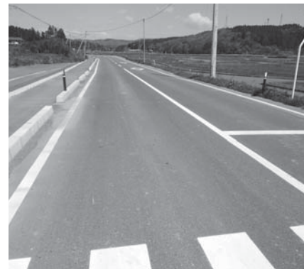
⑪大瓜南側線改良舗装事業(辺地債事業)