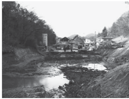
▲防災調整池 (特定防衛施設周辺整備調整交付金事業)