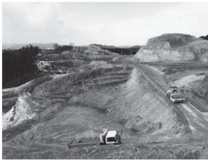
▲住宅団地造成工事現場状況

今後も安全に配慮しながら工事を進めて参りますので、皆さんのご理解とご協力をお願いします。