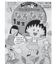
3位 「ちびまる子ちゃんの なぞなぞ1年生」 フォルスタッフ・上田のみ子 著