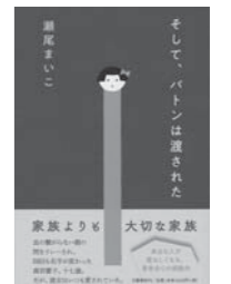
3位 「そしてバトンは渡された」 瀬尾 まいこ 著