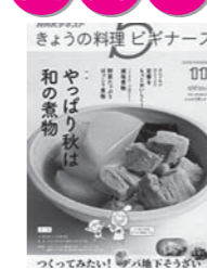
2位 「きょうの料理ビギナーズ」 2019.11月号