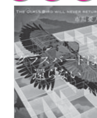
2位 「グラスバードは還らない」 市川 憂人 著