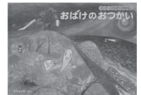
3位 「おばけのおつかい」 西平 あかね 著