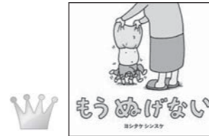
1位 「もうぬげない」 ヨシタケシンスケ 著