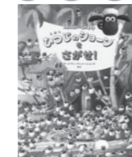
2位 「ひつじのショーンをさがせ」 ウォルター・ウィック 著