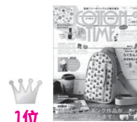
1位 「コットンタイム」 2019.5月号