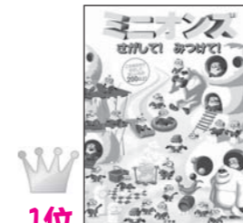
1位 「ミニオンズさがして! みつけて!」 トレイ・キング 著