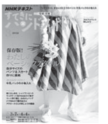
3位 「すてきにハンドメイド」 2019.3月号