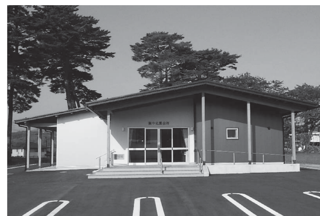
①大衡村公民館衛中北分館建設工事

令和元年度に村内各地で実施・施工した事業は、村民の皆様のご協力により完了しましたので、その主な事業を紹介します。