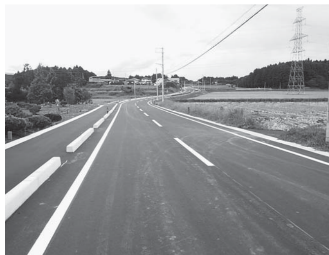
⑥尾西中山線改良舗装工事