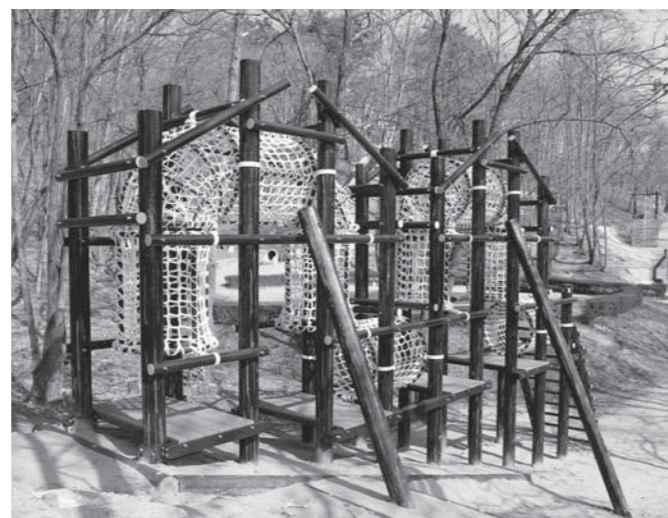
⑦公園遊具更新事業