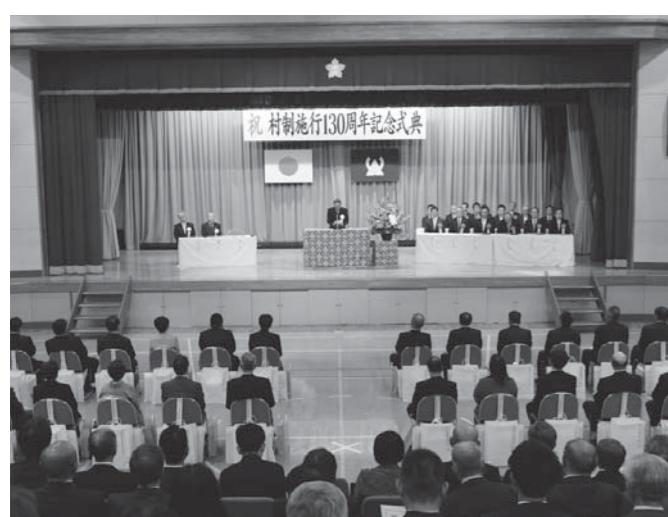
⑬村制施行130周年記念式典