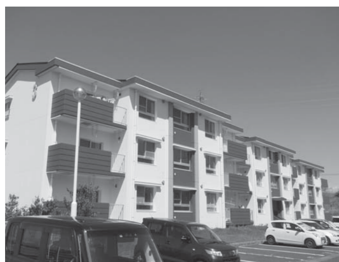
⑧公営住宅長寿命化事業