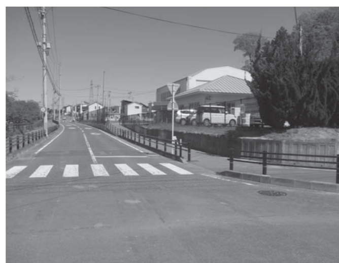
⑪平林線外防護柵設置工事