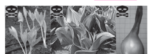
イヌサフラン(左から花・葉・球根)