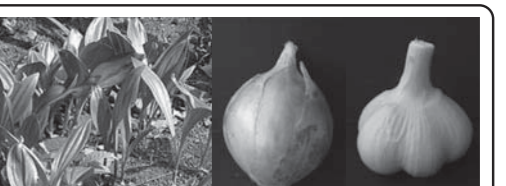
ギョウジャニンニク タマネギ ニンニク