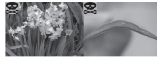
スイセン(花と葉) スイセン(葉の断面)