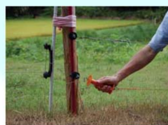
侵入防止柵の設置