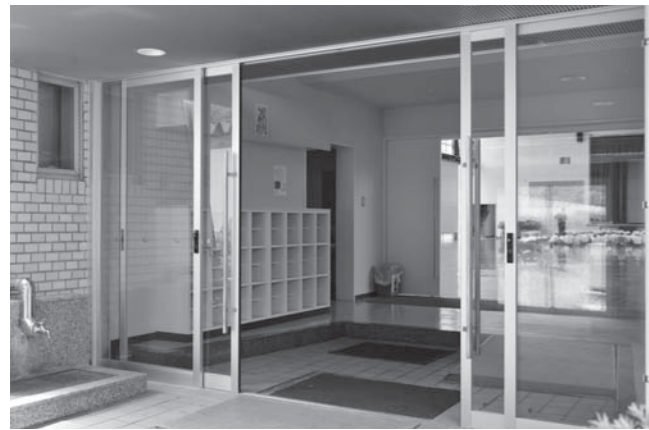
③大衡小学校体育館改修工事

平成29年度に村内各地で実施・施工した事業は、村民の皆様のご協力により完了しましたので、その主な事業を紹介いたします。