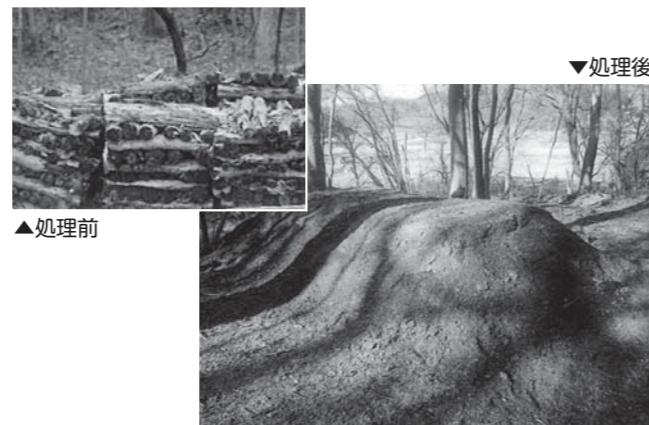
⑯農林業系汚染廃棄物(ほだ木)破砕処理委託