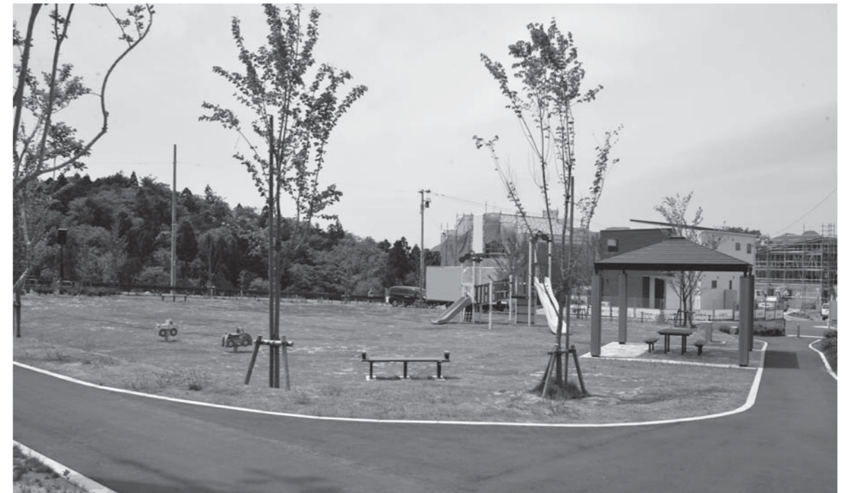
⑩塩浪地区住宅団地整備関連工事