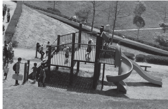
⑧万葉クリエートパーク遊具更新事業(すべり台)