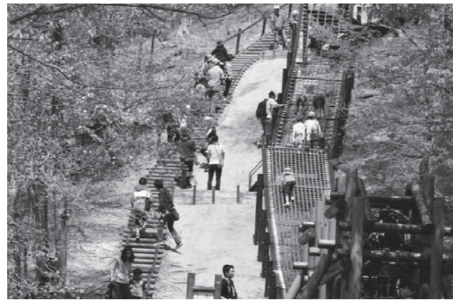
⑧万葉クリエートパーク遊具更新事業(ネット登り)