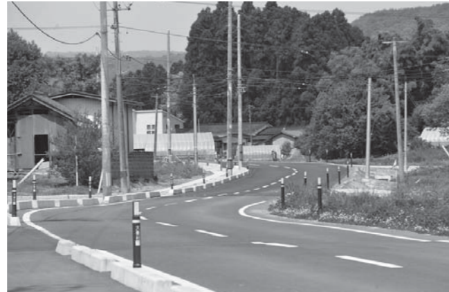
⑨大瓜南側線改良工事