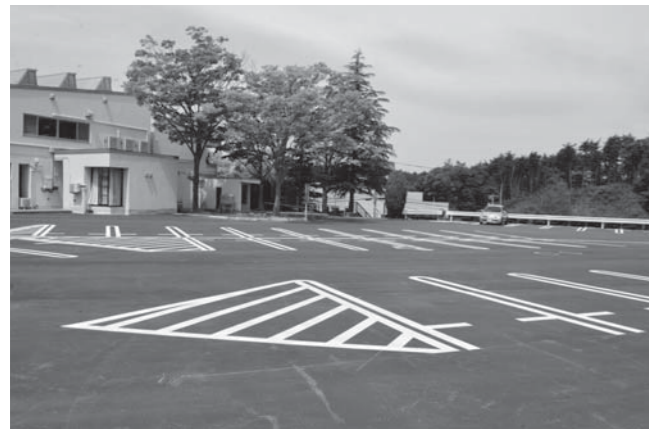
⑥万葉研修センター敷地整備工事