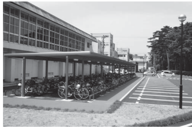
⑤大衡中学校施設整備工事