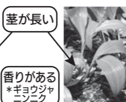
ギョウジャニンニク