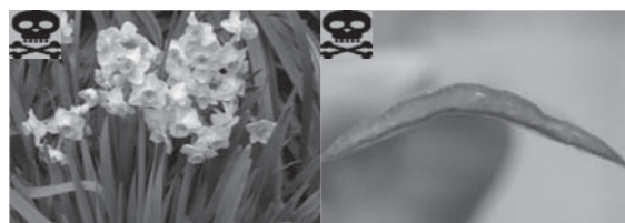
スイセン(花と葉) スイセン(葉の断面)

ポイント 植物全体に有毒成分を含む。症状は悪心、嘔吐、下痢、頭痛、体温低下。重篤な場合は死亡する例もある。 葉をニラやノビルと間違えたり、球根をタマネギと間違えることによる食中毒が多い。 見分け方：香りを確認する。スイセンにはニラやノビル、タマネギのような香りはない。 予防のために：スイセンとニラを近くに植えない。球根を台所に置かない。