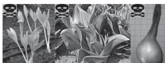
イヌサフラン(左から花・葉・球根)