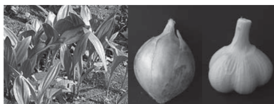
ギョウジャニンニク